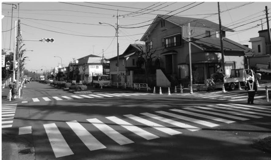
▲車両のコース横断場所となる、めじろ台富士見公園 付近の交差点(裏面地図③)