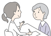
医療ソーシャルワーカー