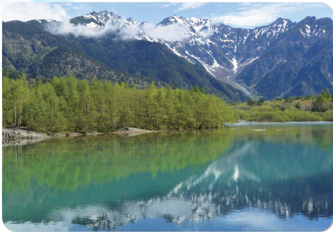
初夏の大正池(上高地)