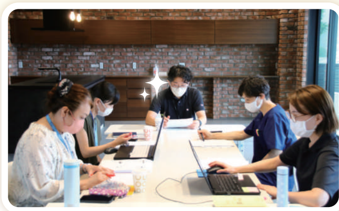
食ナビ 打ちあわせ

意思決定支援っていう切り口で、今やっている様々なことを文章化して、アウトプットできたらいいですね。