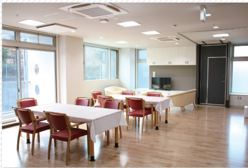
▲ 広々と明るい南向きのリビング。