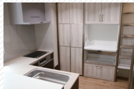
▶ 広いスペースがあるので職員と 一緒に楽しく料理をおこなうこと ができます。