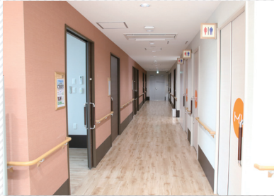
▲ 明るくて広い廊下