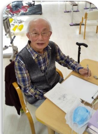
書かれた絵はフロア ーに飾らせていた だいています