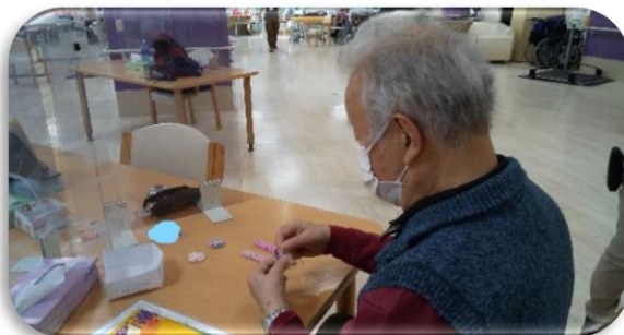
製作 鍵ここクリップ