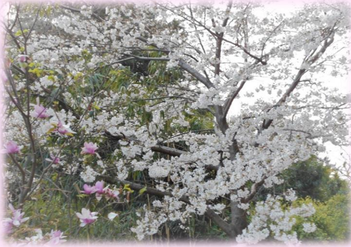
中庭の桜と2階のサクラ