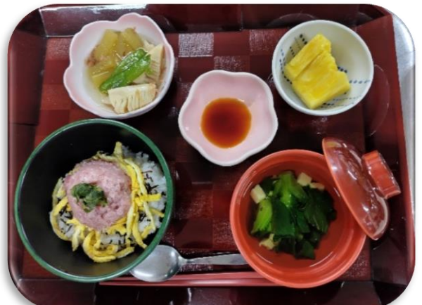
3月の行事食の“ネギトロ丼”