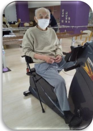
エアロバイクで 自主トレ