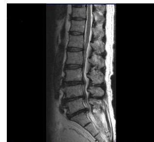
腰部脊柱管狭窄症