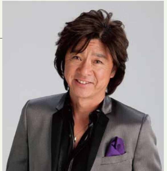
特別講師 西城 秀樹 さん