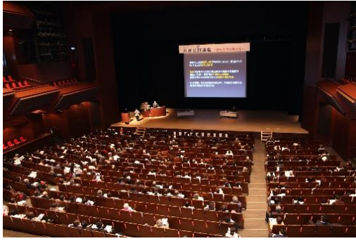
講演1 南多摩病院・外科部長 金森医師